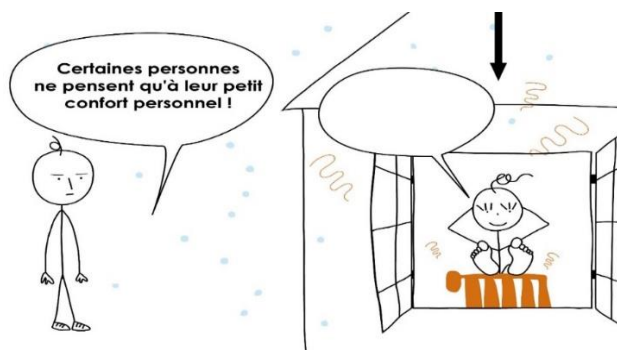
Figure 2 : les dessins illustrant la question « miroir » 9

Certains enquêtés se contentent de réitérer la stigmatisation sur un mode indirect :